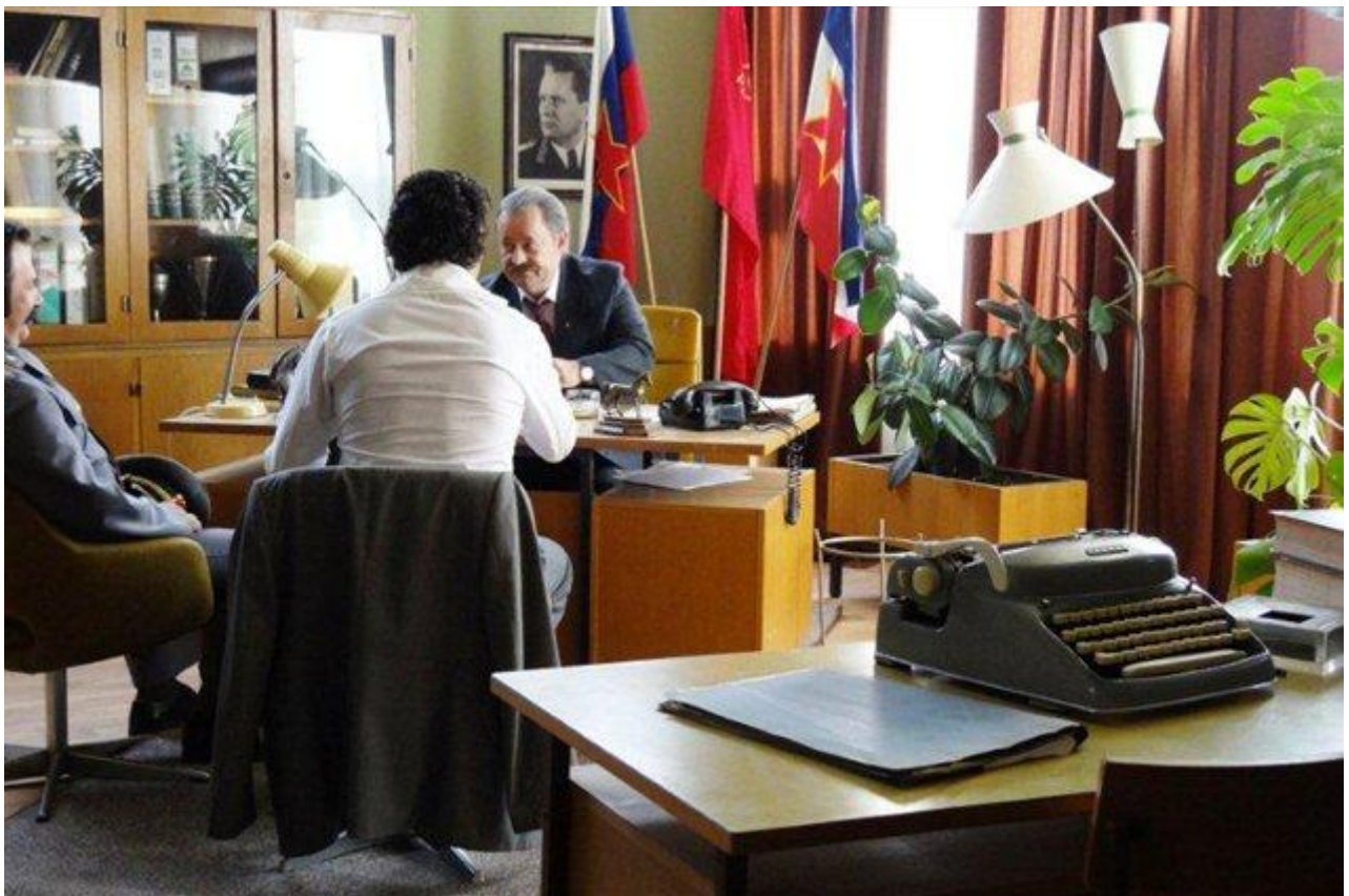
Županova pisarna (postavljena v zapuščeni šoli v MS)

Za slovenski medijski prostor je bil to zagotovo film Petelinji zajtrk. Kar pa zadeva profesionalno delo, je bilo zame sodelovanje pri filmu Heidi nekaj povsem novega. Film angleške produkcije s prepoznavnimi imeni, kot so Geraldine Chaplin in Max von Sydow v glavnih vlogah, je bil večinoma posnet v slovenskih Alpah in v Ljubljani, pri projektu sem sodeloval kot asistent art direktorja. V ekipi je bilo precej več članov kot v katerikoli domači produkciji, delo je bilo bolj definirano in razdeljeno, vsak je delal le svoje delo. Pri domačih projektih se namreč pogosto zgodi, da si sektorji med seboj bolj pomagajo. Film Petelinji zajtrk je bil prvi projekt, za katerega je vedel skoraj sleherni Slovenec. Tako je bila to neke vrste potrditev dela, saj smo naredili nekaj, kar je bilo vsem poznano. Takšen odziv daje poseben zagon za nadaljnje delo. Glede na to, da je bil to moj prvi celovečerec in tako uspešen, se mi je zdelo, da sem lahko kos vsakršnemu projektu. Zdi se mi, da sem se takrat znebil strahu, ki je sicer vedno prisoten v smislu, da se ne ve, kakšen bo rezultat. Drugi takšen film je bil Gremo mi po svoje, za katerega sem v šali celo napovedal rekorden ogled. Vedno sem zelo pozitivno naravnani do projekta, ki ga delam in verjamem vanj. Menim, da je odnos celotne ekipe do samega filma zelo pomemben, saj se na izdelku to močno čuti. Tako je bilo pri obeh filmih in če lahko sklepam po tem, bo film Šanghaj gotovo še ena uspešnica.