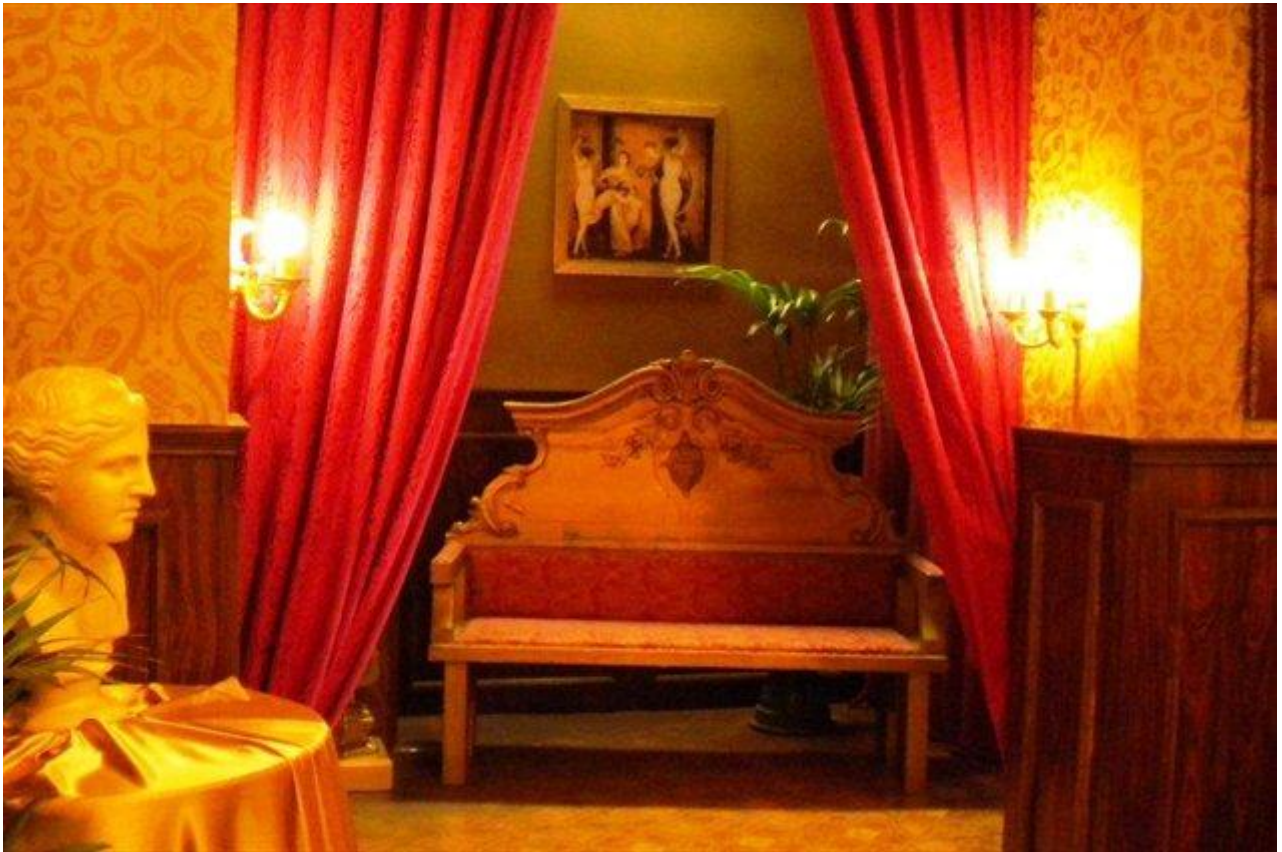
Bordel v Trstu (postavljen v studiu Viba filma)